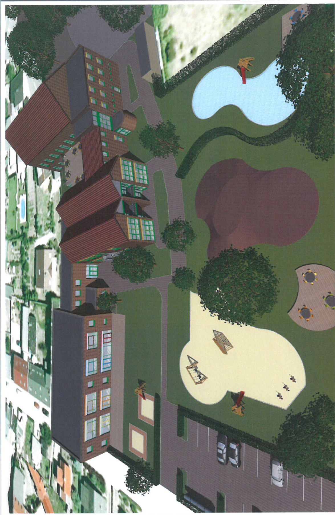
PERSPEKTIVE KINDERZENTRUM BARLEBEN